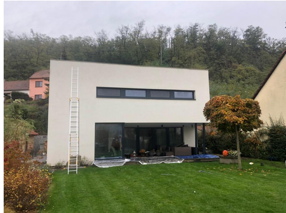
Superficie con trattamento