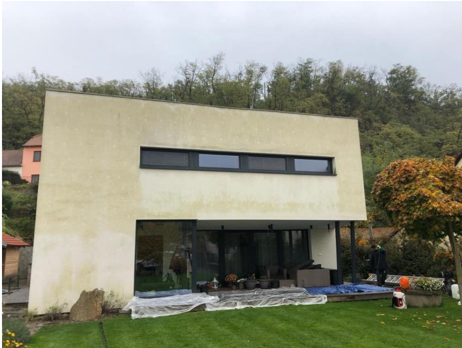
Superficie senza trattamento