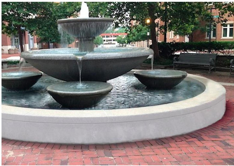
Superficie con trattamento

DLR Stone Protection realizzato per superfici ruvide e lisce. Gli agenti atmosferici danneggiano e sporcano le superfici in modo consistenti. Con un rivestimento invisibile ad occhio nudo, DLR resiste a batteri, muffe e alghe, idrolisi, pioggia acida, inquinanti ambientali e impedisce l'adesione alla superficie.