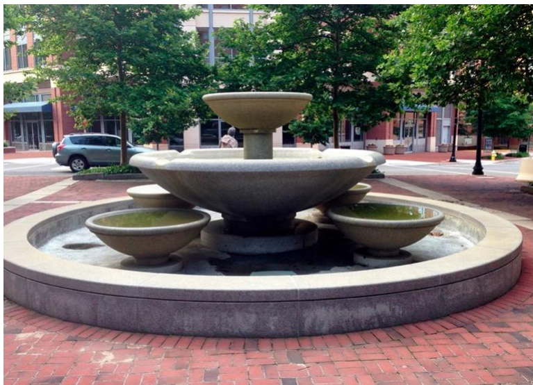
Superficie senza trattamento