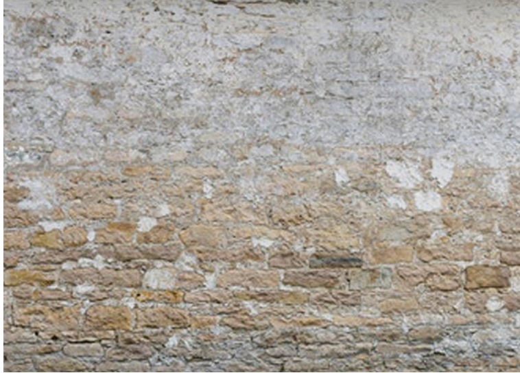
Superficie senza trattamento