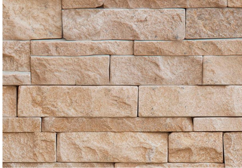
Superficie con trattamento

DLR Stone Protection è realizzato anche per pietre porose che sono particolarmente predisposte all'assorbimento di sporco se esposti agli agenti atmosferici. Con un rivestimento invisibile ad occhio nudo, DLR resiste a batteri, muffe e alghe, idrolisi, pioggia acida, inquinanti ambientali e impedisce l'adesione alla superficie.